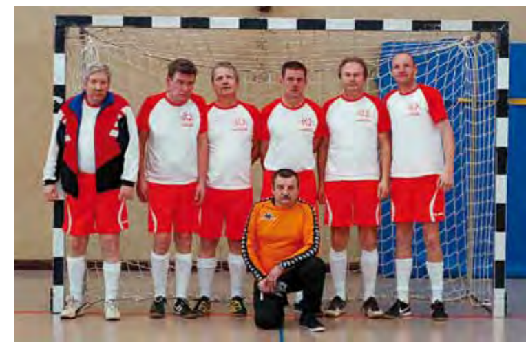
Die Mannschaft vom LV Mecklenburg-Vorpommern lief in eigens für das Turnier angefertigten „Freundeskreis-Shirts“ auf