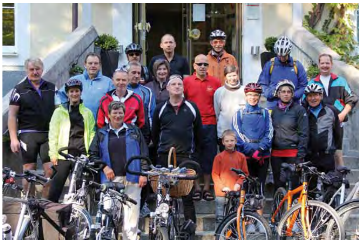
Radeltreffen des LV Bayern