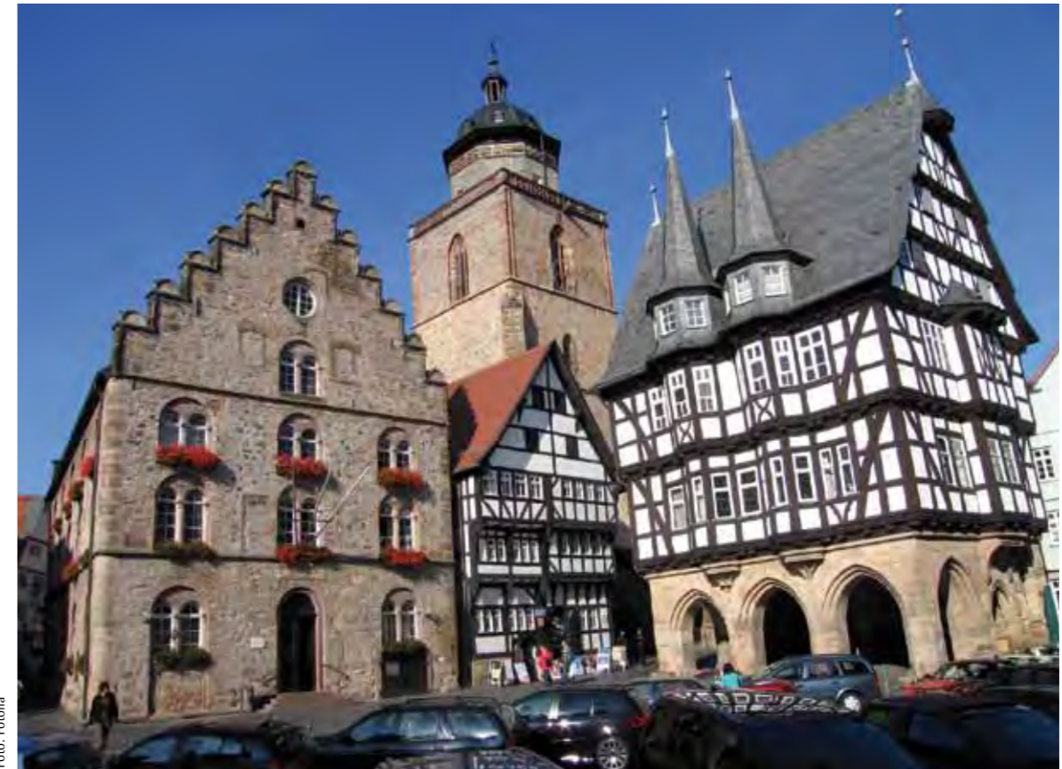
Marktplatz Alsfeld mit dem 500 Jahre alten Rathaus