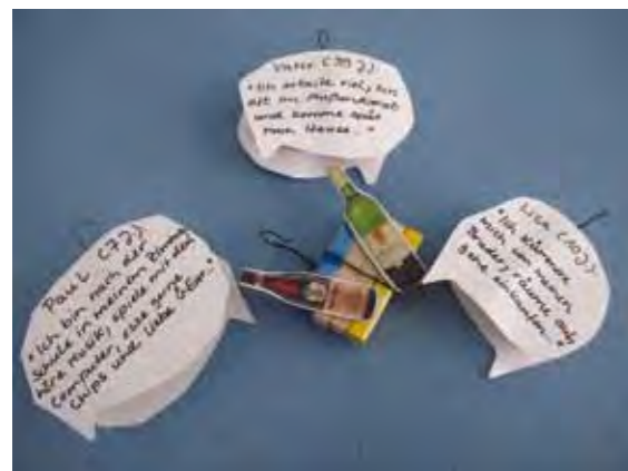
Rollenspiele und Gruppen-gespräche

Weitere Informationen unter www.freundeskreise-sucht.de