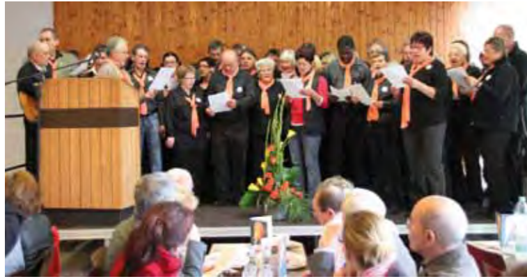
Chor des Freundeskreises Westerwald

■ „Freunde holen dich aus der Hölle“ – mit diesem Lied begrüßte der Chor des Freundeskreises Westerwald die Gäste zum ELAS-Tag und zum 35-jährigen Vereinsjubiläum. Das Thema des Tages „Freude am suchtfreien Leben“ entsprach dem Wunsch der Mitglieder, nicht die negativen Folgen des Suchtmittelmissbrauchs zu bedenken, sondern die positive Seite der Abstinenz hervorzuheben. Niemand, der eine Suchtkarriere beendet hat und abstinent lebt, muss sich für diesen beschwerlichen Weg schämen. Aber wie verändert sich das Leben, wenn das Suchtmittel wegfällt und keine „Stimmungsaufheller“ mehr eingesetzt werden? Muss dann auf alles verzichtet werden, was Spaß macht? Dass dies nicht der Fall ist, gehört zu den Vermittlungsaufgaben der Sucht-Selbsthilfe. Bei den Aktionen unseres Freundeskreises sind alle von Sucht betroffenen Menschen involviert: Partner/innen, Kinder, Freunde/innen, Eltern und Abhängige. Denn alle müssen