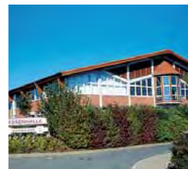
Tagungsort Hessenhalle Alsfeld

Befassen wollen wir uns mit der demografischen Entwicklung in den Freundeskreisen. Bei dem Treffen wird es darum gehen, die Werte der Freundeskreisarbeit hervorzuheben und sich gleichzeitig den